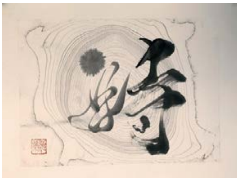
時 (TOKI)-TEMPS L'encre sur le papier suminagashi 30cm x 40cm-2023 325€