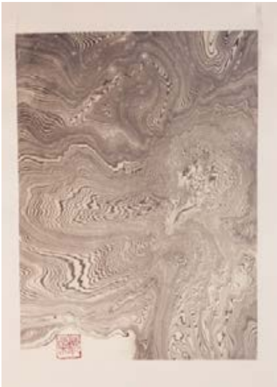
墨流し(SUMINAGASHI) 04 Encre sur papier de riz marouflé 30x40cm-2023 325€