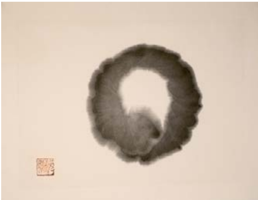
円相 - ENSÔ 018 Encre sur papier de riz marouflé 30x40cm-2024 325€