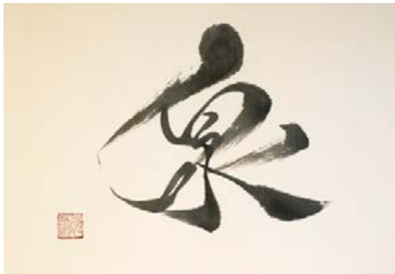
泉 (IZUMI)-SOURCE Encre sur papier de riz marouflé 30x40 cm-2024 325€