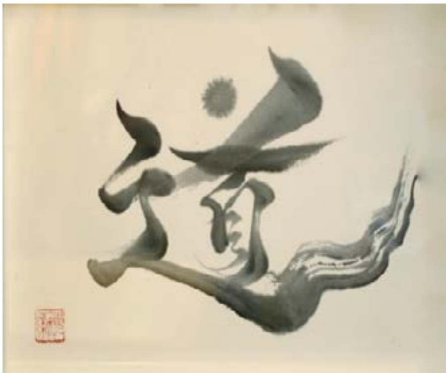
道 (MICH) - CHEMIN, VOIE Encre sur papier de riz marouflé 30x40cm-2021 325€