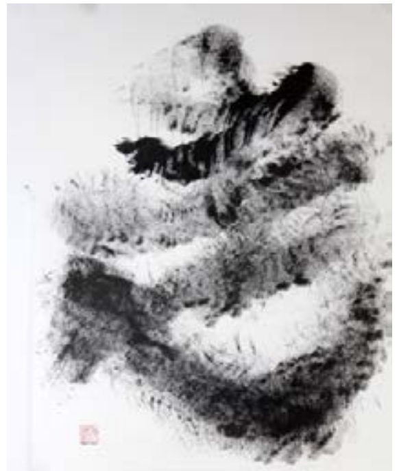
走(SÔ) - COURIR Encre de chine sur le papier 65 x 50cm-2019 650€