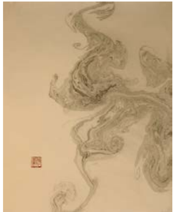
墨流し(SUMINAGASHI) 11 Encre sur papier du japon, 42x52cm-2023 520€