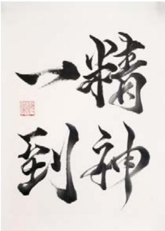
精神一到 (SEISHINN ITTÔ) VOULOIR C'EST POUVOIR Encre de chine sur papier de riz marouflé 30x40cm-2022 325€