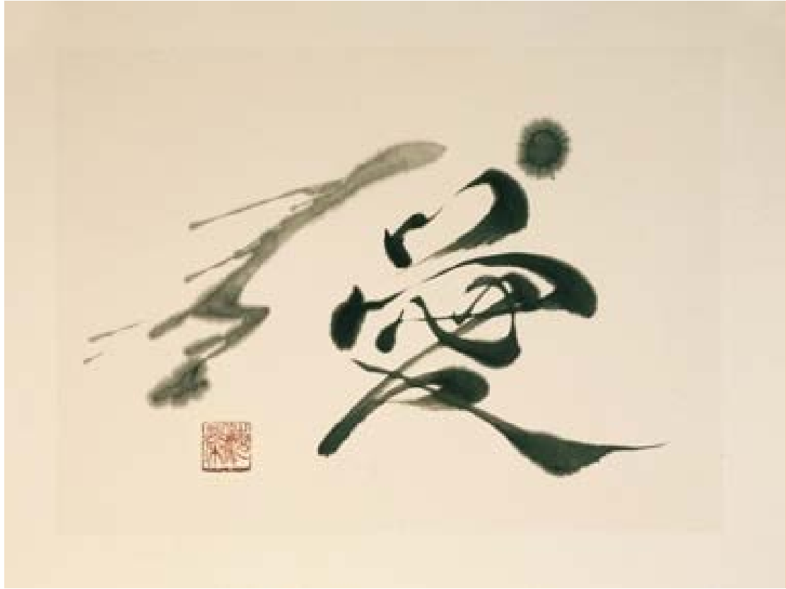
愛 - (Aǐ) AMOUR encre sur papier de riz marouflé 30x40cm-2023 325€