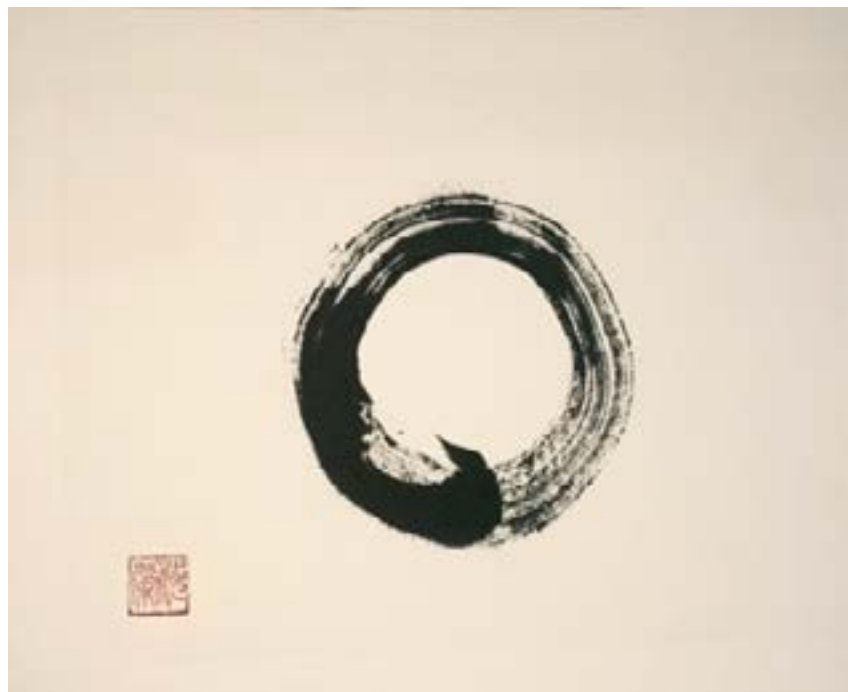
円相 - ENSÔ 015 Encre sur le papier de riz marouflé 30x40cm-2024 325€