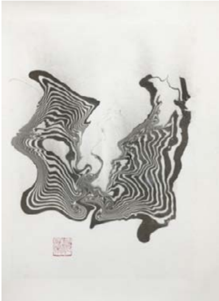
墨流し (SUMINAGASHI) 01 Encre sur papier de riz marouflé 30x40cm-2022 325€