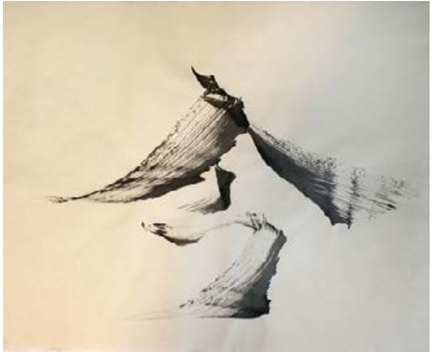
今 (IMA) - MAINTENANT- PRÉSENT encre sur papier du japon 42x52cm-2023 520€