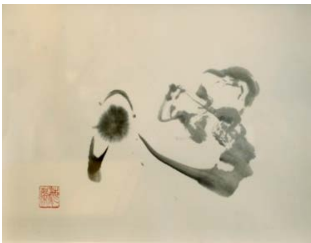
心 - (KOKORO) CŒUR comme "centre absolu des des émotions et des sentiments amoureux humain" Encre sur papier de riz marouflé 30x40cm-2023 325€