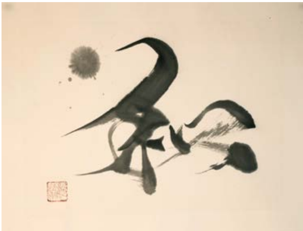
和 - (WA) HARMONIE OU PAIX Encre sur papier de riz marouflé 30x40cm, 2024 325€